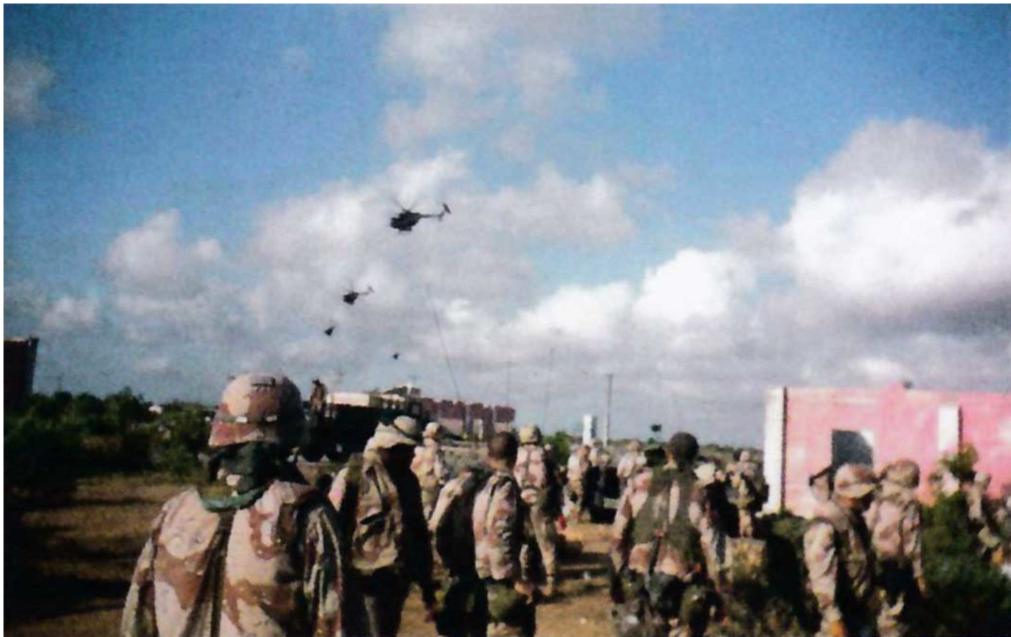
Звено "Звезд" MH-6 (невооруженных "Маленьких Птичек" с наружными скамьями для размещения операторов "Дельты") взлетает с аэродрома 3 октября.