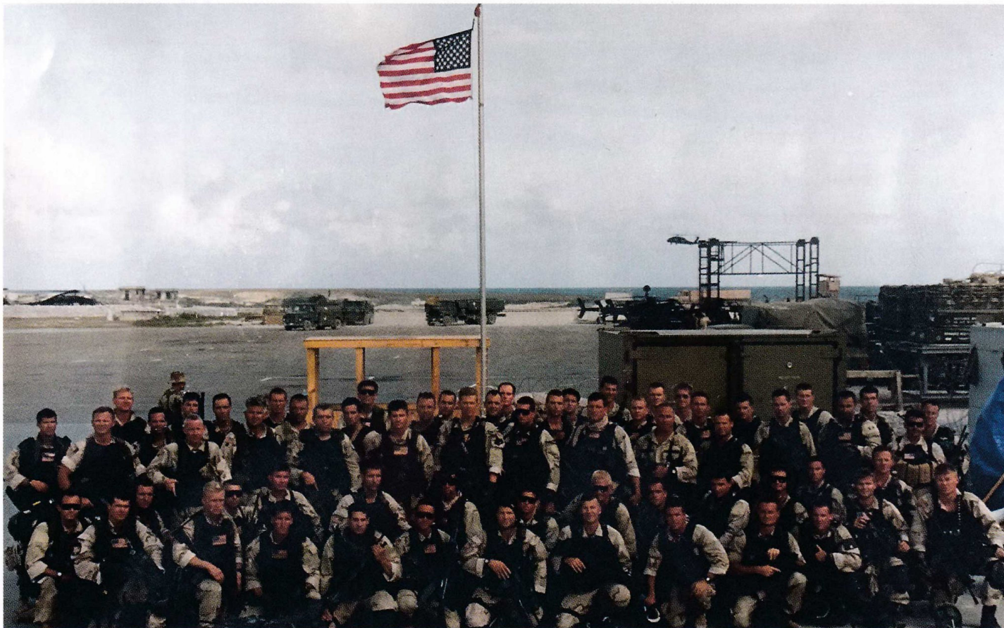
Групповая фотография Эскадрона "С" и подразделений обеспечения у ангара. Находящееся на виду оружие включает в себя 7,62-мм винтовки M14, дробовики 12 калибра Remington-870, CAR15 со смонтированными дробовиками Master Key, SAW M249 с выдвижными прикладами и CAR15 с подствольными гранатометами M203. (Пол Леонард)