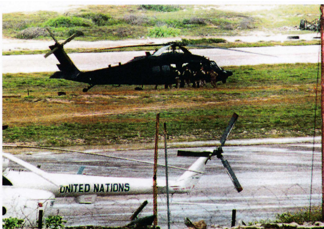
Несколько неопознанных членов оперативной группы "Рейнджер" возле МН-60 160-го в международном аэропорту Могадишо 28 августа 1993 г. К сожалению, качество фото слишком плохое, чтобы различить номер "Блэкхока".