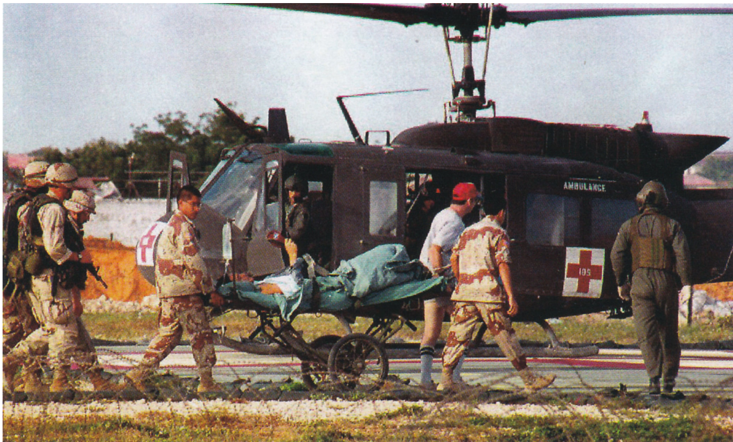
Пилот "Супер 64" Майк Дюрант, заснятый в начале своего пути обратно в Штаты из 406-го полевого госпиталя 15 октября 1993 г. Обратите внимание на охранение из Рейнджеров, сопровождающее каталку.