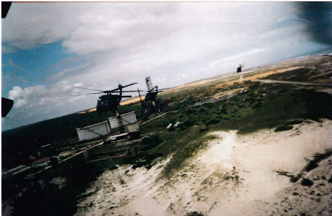
Сделанное из "Супер 64" во время одной из предшествующих задач над пригородами Могадишо фото летящих позади "Блэкхоков" "Супер 65", 66 и 67. (Джерри Иззо)