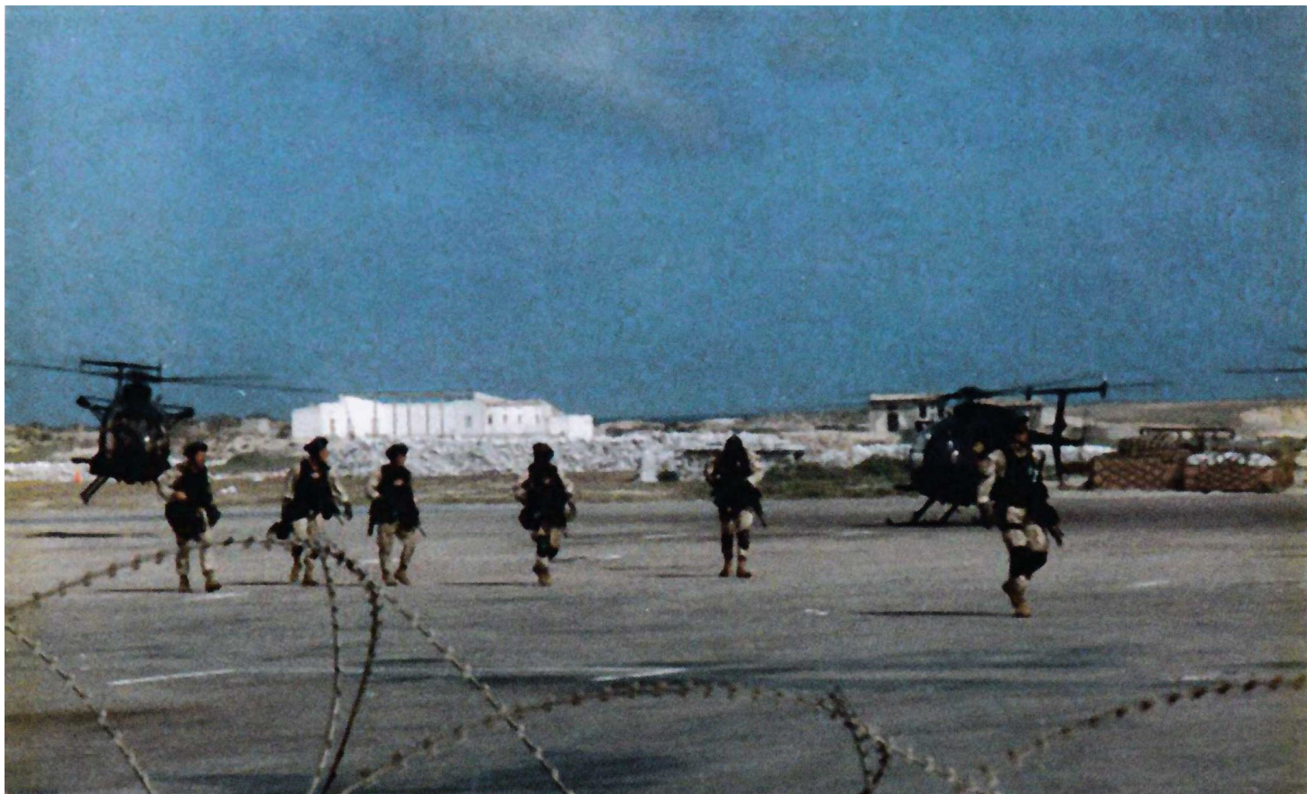
Операторы "Дельты" возвращаются в ангар с одной из предшествующих задач. На двух "Маленьких Птичках" установлены "людские подвески" (официально Система внешнего размещения личного состава – External Personnel System), также видны кронштейны крепления спусковых канатов (Fast Rope Insertion/Extraction System – FRIES) (из частной коллекции)